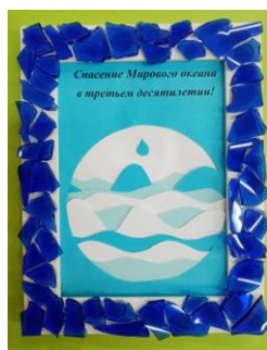
Рамочка из стекла