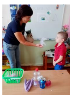
Экспериментирование с пластиком, стеклом и бумагой