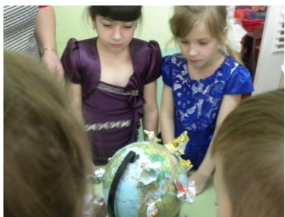
Макет масштабов экологической катастрофы

Для изучения проблемы мусора в природе, воспитанники детского сада были включены в познавательно-исследовательскую деятельность: дети экспериментировали с бумагой, стеклом и пластиком, изучали их свойства.