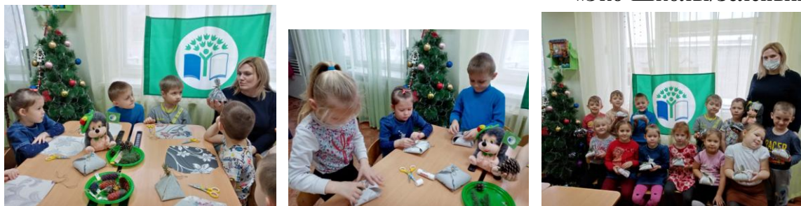
Экологическая упаковка для Новогоднего подарка

Другая подгруппа детей упаковала свои новогодние подарки в стеклянные и металлические баночки, уже бывшие в употреблении. В качестве украшения использовали бумагу, пряжу, новогодний декор и др.