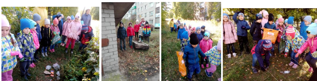
Исследование экологической ситуации

В ходе экскурсий и прогулок, участники воочию увидели неблагоприятное состояние окружающей среды, на основе чего были выявлены экологические проблемы: