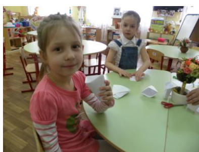
Творческая мастерская «Наш эко стаканчик»

Семьи воспитанников – наши помощники и единомышленники. Они принимают активное участие в конкурсах, творческих мастерских и мастер-классах, направленных на создание многоцветных альтернатив всему одноразовому.