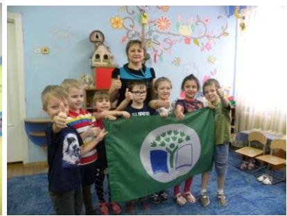
Наш Зелёный флаг

В соответствии с правилами Международной программы «Эко-школы/Зеленый флаг», приоритетными темами на 2020-2021 учебный год были выбраны темы: «Рациональное управление отходами» и «Здоровый образ жизни».