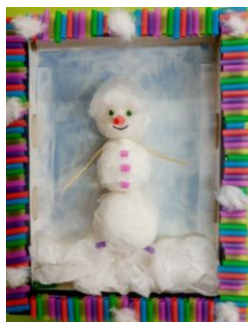
Рамочка из трубочек