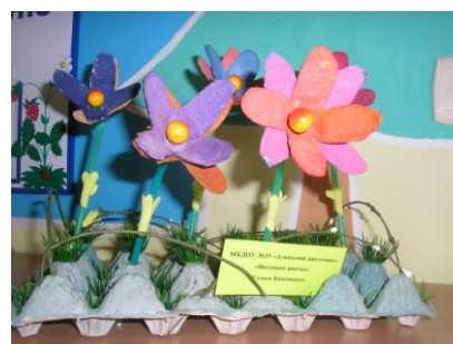
Конкурс «Вторая жизнь упаковки»

Экологический проект «Секреты упаковки» получился значимым для всех его участников. Для детей – это первый опыт познавательной деятельности, направленной на знакомство с глобальными проблемами окружающей среды; для родителей - повышение уровня экологической культуры и возможность общения с ребёнком; для педагогов - удовлетворение от результатов своей деятельности, новые методические находки, направленные на охрану природы от загрязнения бытовым мусором.