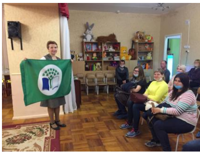
Заседание экологического совета

После подведения итогов, принято решение: в 2020-2021 учебном году продолжить участие в Программе.