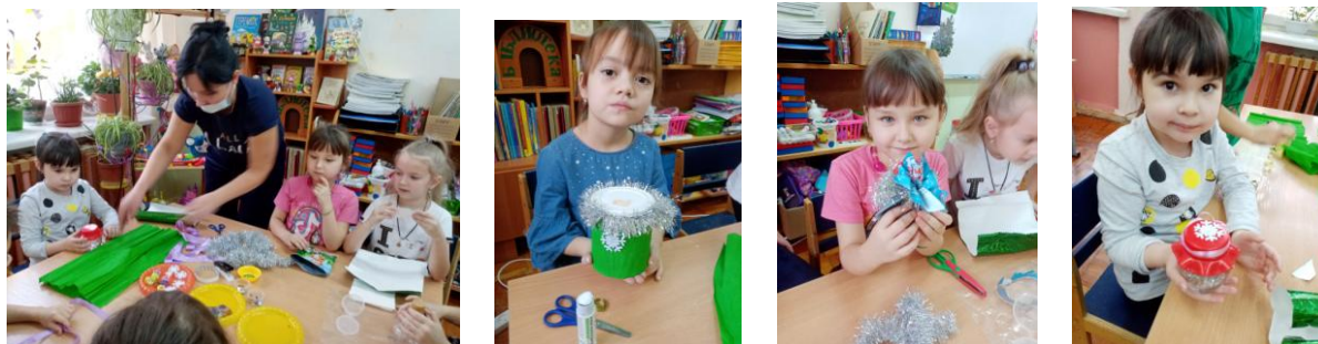
«Вторая жизнь» упаковки

Перед началом творческой деятельности вспомнили с детьми, что стеклянные и металлические упаковки обеспечивают наилучшую сохранность товара на долгие годы, а умелые руки могут дать им «вторую жизнь». Полученный результат в виде упаковки для новогоднего подарка, будет долго радовать детей и их родителей, напоминая о возможности вторичного использования упаковки для творческой деятельности.