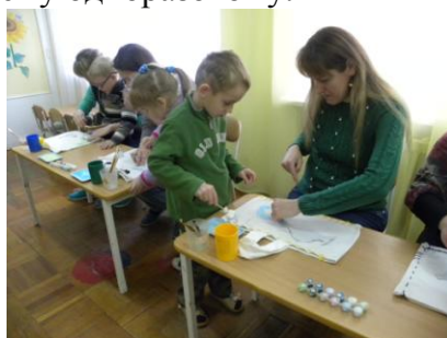
Мастер-класс «Экосумка своими руками»