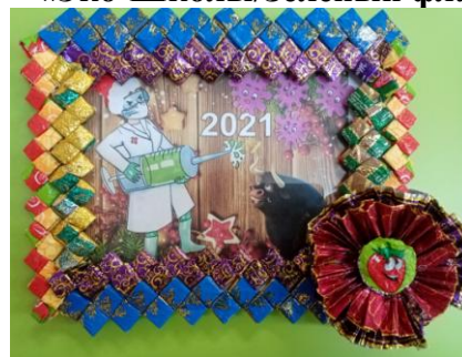
Рамочка из конфетных фантиков

Вторичному использованию мусора способствует сбор макулатуры. По итогам акции «Собери макулатуру - спаси дерево», в 2021 году участниками образовательных отношений было собрано 656 кг. макулатуры.