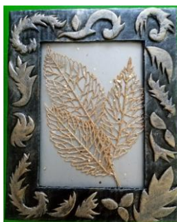
Рамочка из картонной коробки