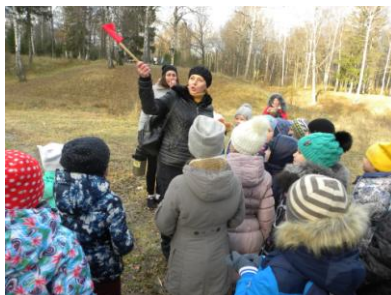
Беседа во время эколого-оздоровительного похода «Поможем природе – сохраним здоровье»