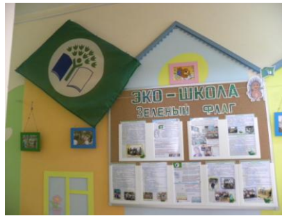
Информационный стенд «Эко-Школы/Зеленый флаг»