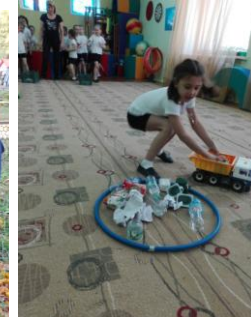
Игра «Рассортируй мусор»

По результатам экспериментирования были сделаны выводы: